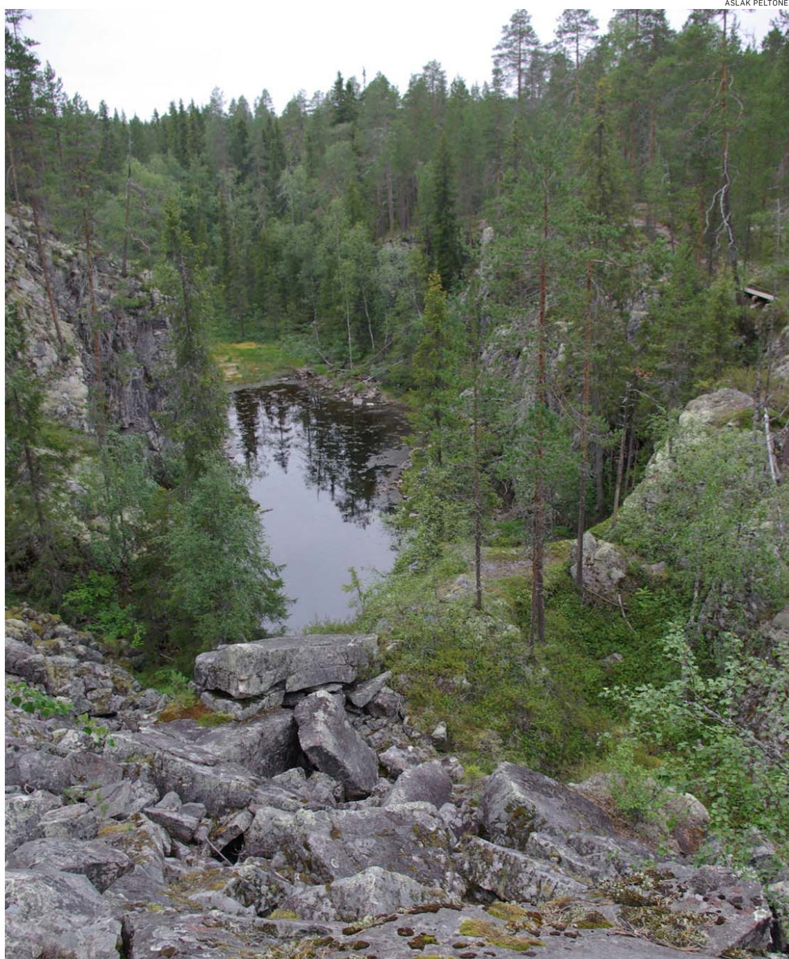
Hiidenportin luonto on jylhää ja vaikuttavaa.

Hiidenportti "löydettiin" tietoisuuteen vasta Rappasotien aikoihin, jolloin vienalaisten vangiksi otama sotkamolaistyttö eksyi pako-matkallaan Hiidenporttiin, piiloutui nykyisten portaiden luona olevaan halkeamaluojaan ja pelastui Vienan orjuudesta. Kotonaan hän kertoi