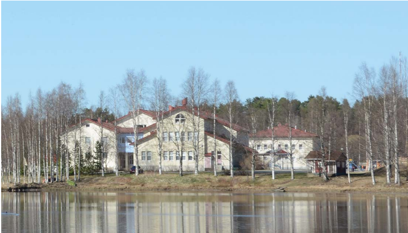
Salmelan alue valmistautuu kesän 2015 Herättäjätjuhliin. Siellä päästään laulamaan yhdessä uusia Siionin virsiä. Voit tutustua niihin jo nyt.