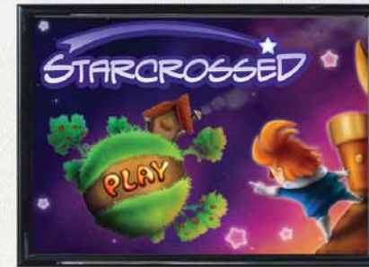
KAJAANIN AMMATTIKORKEAKOULUN PELIALA