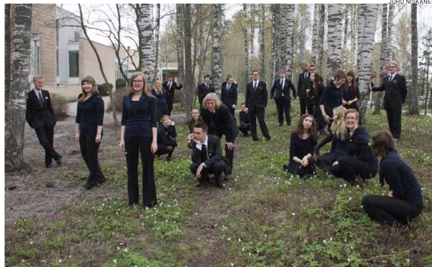
Hengellinen nuorisokuoro on jo ehtinyt esittämään uusia Siionin Virsiä.

suksia, joissa uudistustyössä mukana olevat esittelevät virsiä kerton samalla työskentelytavoista ja perusteluista.