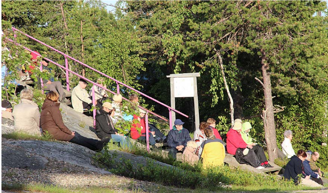
Sotkamonseurakunnan toiminta on monimuotoista. Juhannusseurat Vuokatinvaaralla kuuluvat perinteisesti kesän ohjelmaan.

Gallen-Kallelan tiedetään raapustaneen Vuokatilla luonnoksia maalauksiinsa, kansallisrunoilija Eino Leino haki jylhää inspiraatiota myös Vuokatin vaaroilta, Aleksis Kivi kirjoittaa kahdesti Vuokatista Seitsemässä veljeksessä ja monet muutkin kansalliset ja kansainväliset taiteilijat ja kulttuurihenkilöt tunsivat Vuokatin.