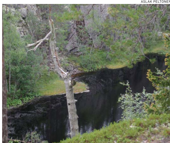
Hiidenportin pohjalla on tummavetinen lampi.

kirpeän hapan. Siihen on kerääntynyt syksyn pakkasissa ja räntäsaateissa kaikki rämesuon katkeruus, elämäntuska ja loppusyksyn toivotomuus. Kuinka ihmeessä sama suo voi kasvattaa kahta niin erilaista lastaan?