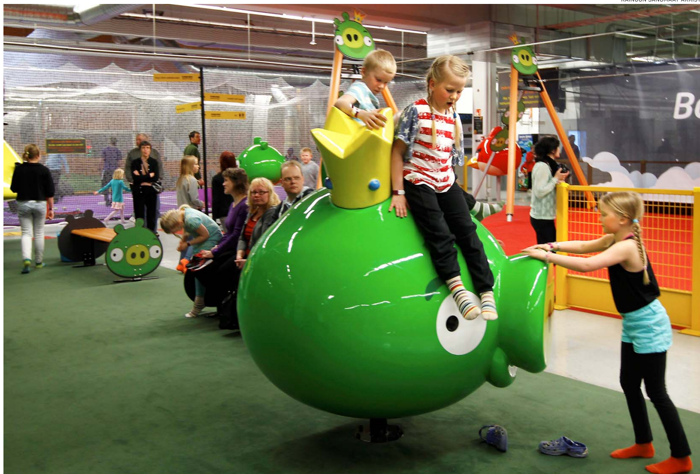
Myös erilaisista peleistä tutut hahmot on muovattu leikkeihin sopiviksi.