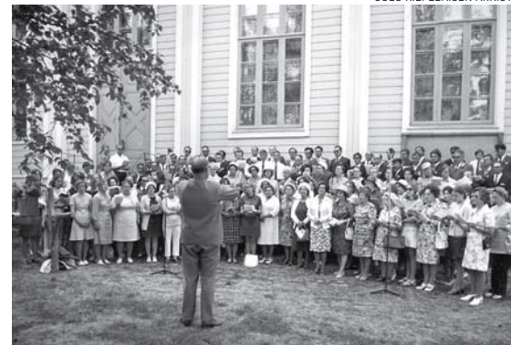
Heränneiden kuoro esiintymässä.

virsi 197, "Kiitos Karitsa kuollut ja ylös noussut myös, sun nimees kokoonnuimme, se on sun armotyös."