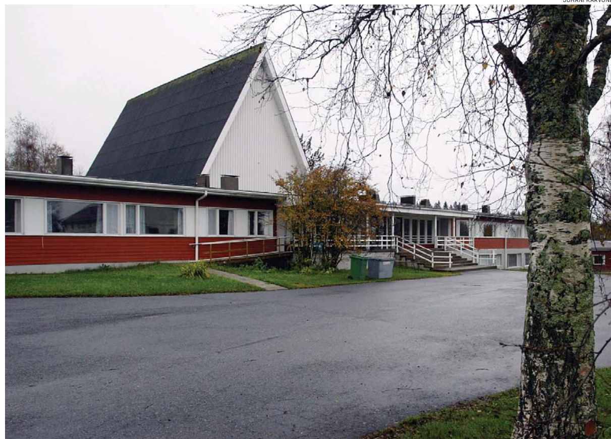
Kainuun Opisto on toiminut yli sata vuotta Mieslahdessa.

Heitä on vuosittain yli kymmenestä maasta, esim. Somaliasta,