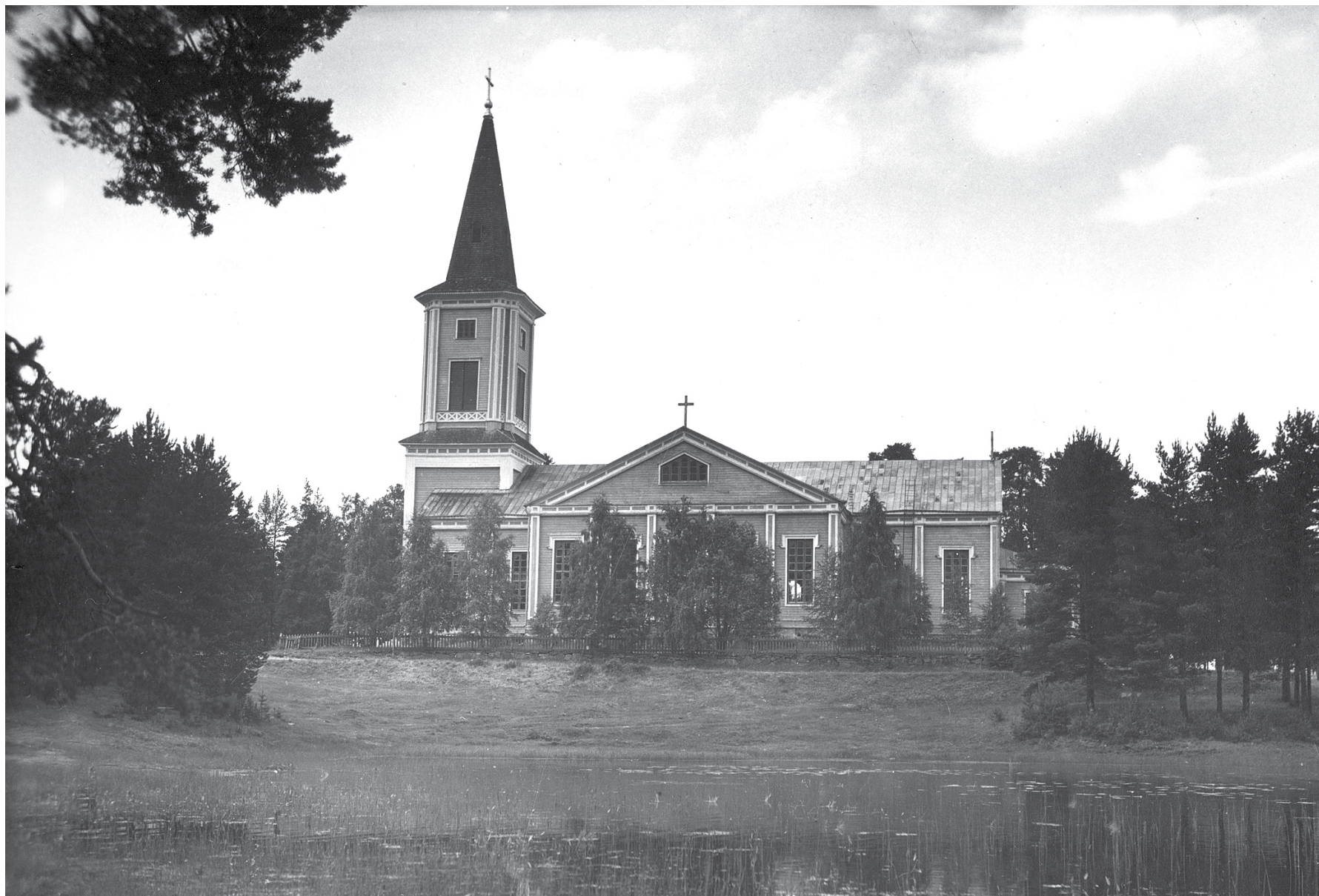
Sotkamon kirkko 1950-luvulla korjauksen jälkeen.