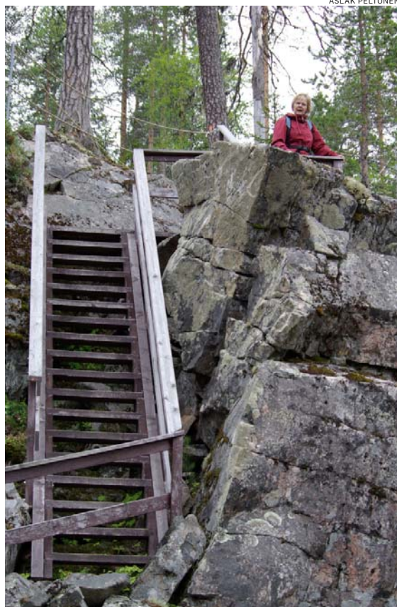
Joissakin paikoissa liikkumista helpottavat rakennetut portaat.