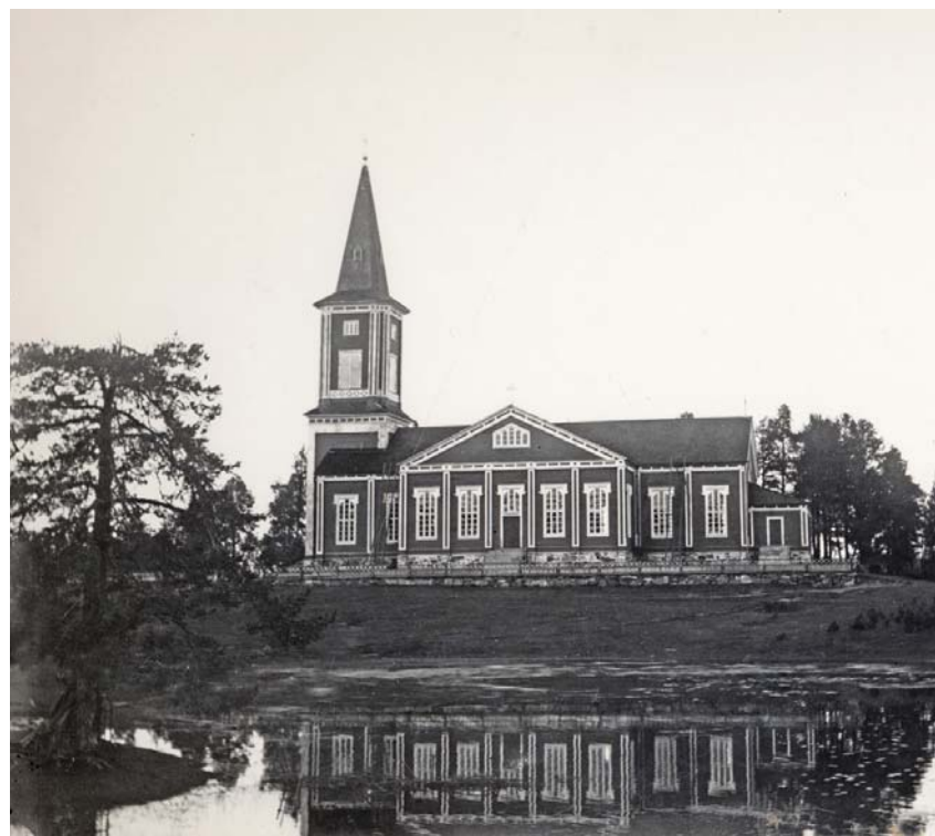
Sotkamon kirkko Herman Renforsin kuvaamana 1900-luvun alkupuolella.