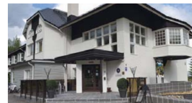
Puhelujen hinnat: 030-alkuisiin numeroihin: Lankapuh: 0,0828 e / puhelu + 0,032 e/min Matkapuh: 0,19 e/min. Jonotusaika on maksullinen. Hinnat sis. alv 23%.