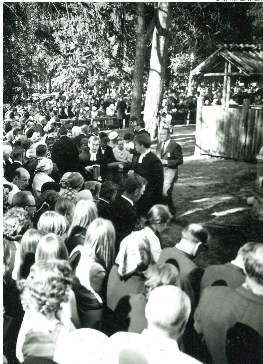
Juhlaväki järjestäytymässä ehtoolliselle.

Kun kaikki oli valmista juhla varten ja perjantai-illan aatoseurojen piti alkaa, koväänisistä kaikui kirkonkylän valloittavana Siionin