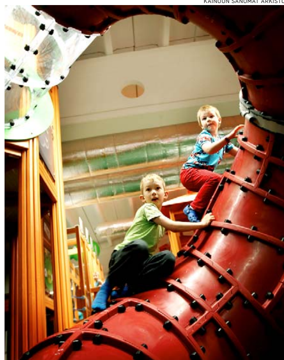
Angry birds -puistossa lapset pääsevät testaamaan liikunnallisia taitojaan.

– Kaikkea kannattaa kokeilla ennakoluulottomasti. Esimerkiksi pesäpalloon kypsyneet saavat varmasti kokonaan uudenlaisen kokemuksen lajista testatessaan sitä erilaisessa ympäristössä, Kähkönen huomauttaa.