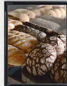
PEKKA HEIKKINEN & KUMPP.