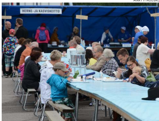
Muun muassa juhlaevän ruokailujen järjestämiseen tarvitaan runsaasti vapaaehtoisia. Kuvaa Haapajärven juhlista viime kesänä.

Ei palkkaa tai palkkiota, vaan uusia ystäviä ja upean yhteisöllisyyden kokemuksen. Ja talkoopaidan, mitä ei saa muuten kuin kökkään osallistumalla. Samanlaisen paidan käyttäjä voi myöhemminkin tervehdiä ystävänä, samaa kokemusta jakavana ihmisenä.