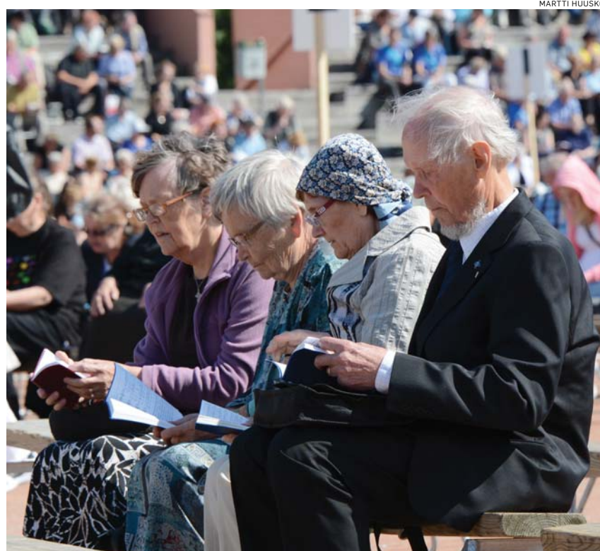
Siionin virret ja niiden veisuu liittyy kiinteästi Herättäjäjuhljen tapahtumiin.

Kun muutama vuosi sitten kaikissa maamme herännäisseuroissa kirjattiin seuroissa veisatut virret, lyhyenä oppimääränä. Siksi sitä on hyvä veisata tuon tuostakin. Viime vuosina herättäjäjuhljen tunnuksiksi on useimmiten valittu säe Siionin virsistä. Oli luonnollista, että Vuokatin vaaroistaan tunnetun Sotkamon juhlien tunnuksiksi seuloit monien joukosta säe "En pelkää vaarojen matkaa" (Sv. 173:4).