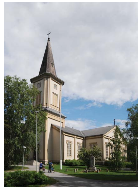
Sotkamon kirkko nykyisessä kesä-asussaan.

Lähteet: Kainuun Kirkot, 1997, Kainuun Sanomat, kesäkuu 1955.