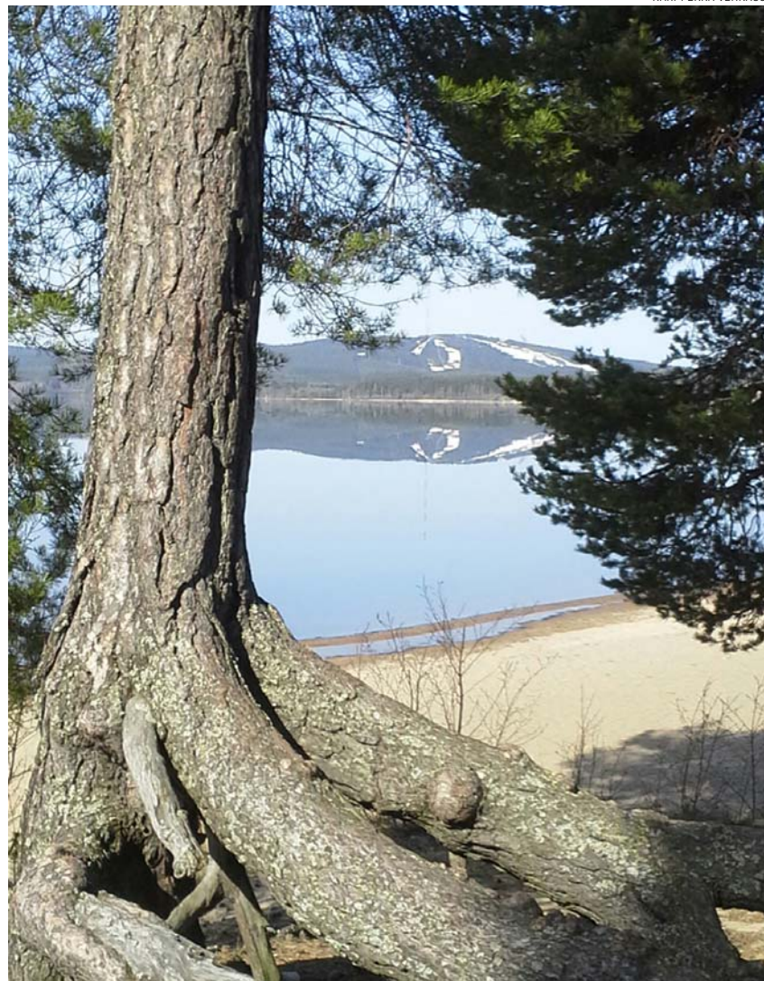
Omallalla hiljaisella tavallaan tuo hiekan alta paljastunut männyn juuristo kertoo meille siitä, miten luonto hoitaa kasvattamaansa.