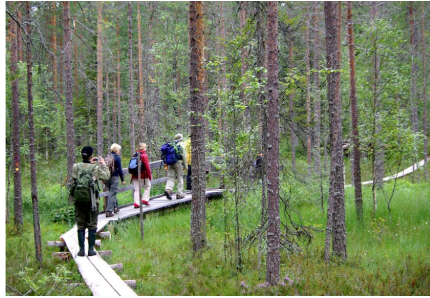
Sotkamon Hiidenportin luontoa