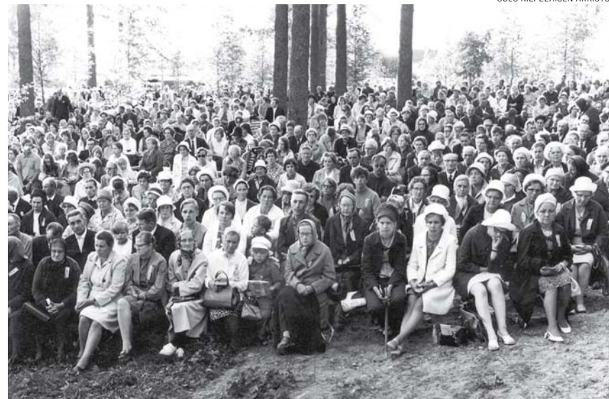
Sotkamon Herättäjäjuhlien juhla-alueen suurten petäjien siimeksessä.