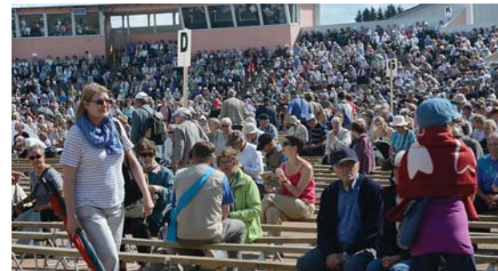
Haapajärven Herättäjäjuhlien seuraväkeä juhkakentällä.

Joensuussa ja Kuopiossa yhdistyksellä on heränneiden ylioppilaskoti (Körttikoti) ja Kuopiossa sen yhteydessä on myös yhdistyksen toimipiste.