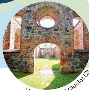
Vanhan Vaasan rauniot (2).