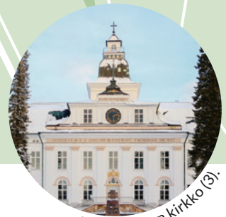
Mustasaaren kirkko (3).