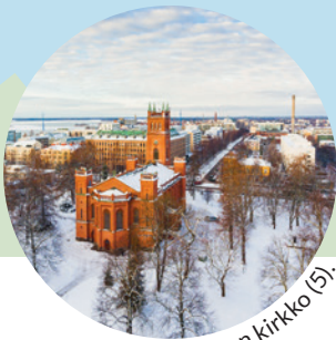
Vaasan kirkko (5).

Tee retki Vaasan hengellisyyden historiaan tämän kartan avulla.