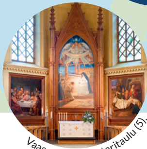
Vaasan kirkon alttaritaulu (5).